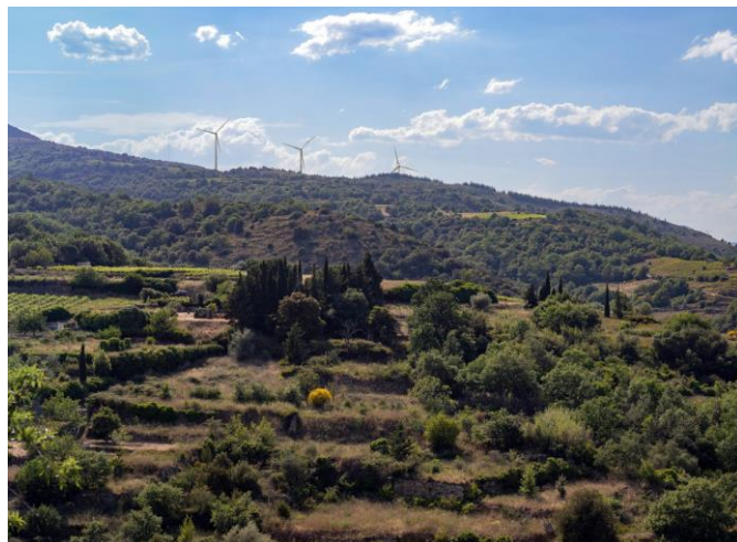
Simulation fournie par le promoteur vue du bas du village