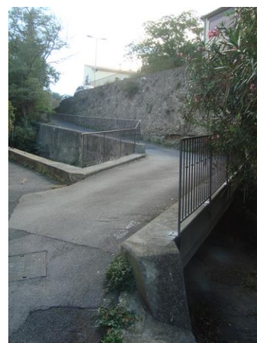
Nouvelles rambardes au Rec.