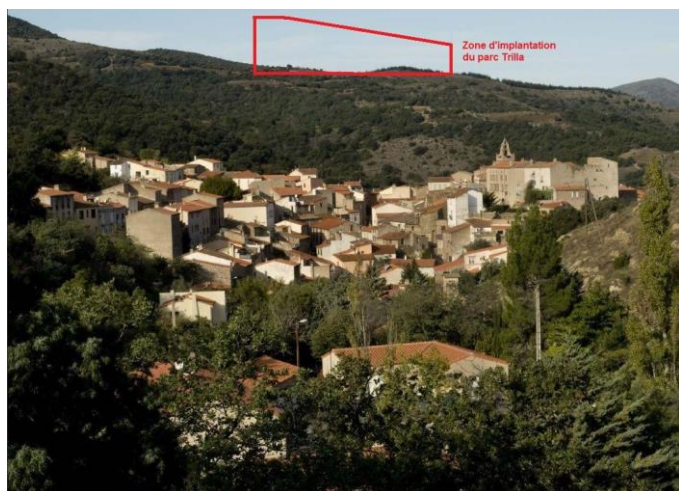
Lieu d'implantation surplombant le village

Ce petit texte de présentation est une synthèse de l'arrêté préfectoral affiché en mairie, pour le dépôt de vos remarques, consulter la feuille supplémentaire glissée dans ce numéro.