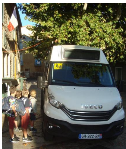
Rentrée des classes

Fête de septembre : L'équipe municipale tient à remercier les carmagnols et sympathisants pour leur présence à la soirée paella sur la place. Plus de 150 personnes étaient présentes le samedi 28 septembre.