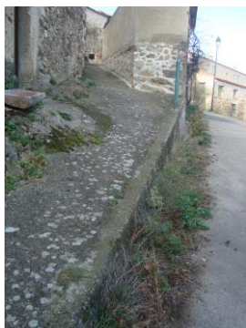
Sécurisation par rambarde fer

Carnaval école. Vendredi 15 mars déambulation des enfants déguisés dans les rues du village à partir de 9h30. Goûter offert par la municipalité ouvert à tous à 10h00 à la salle des fêtes.