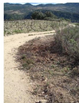
Débroussaillage lutte anti incendie