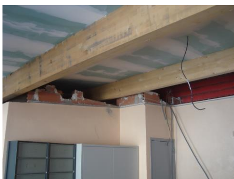
Aménagement de la future salle d'Archives