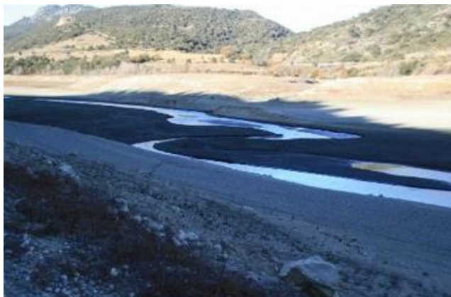
Déficit en eau de notre barrage – début janvier