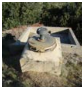
Dessus du château d'eau