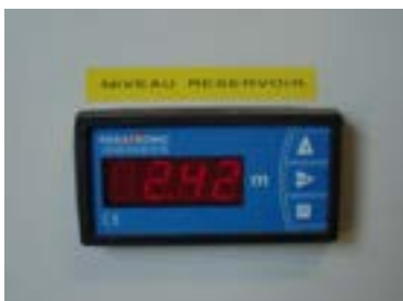
Contrôle du niveau d'eau dans la réserve