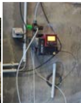
Machine automatique de traitement de l'eau