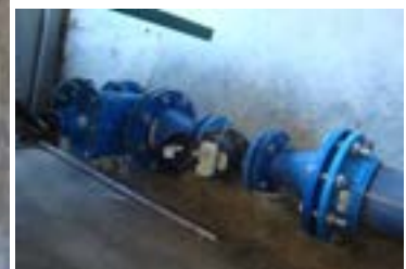
Vanne d'arrivée au château d'eau